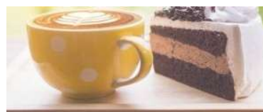
画像⑪ 創作活動・日常のふれあい

月例カフェで、提供する菓子などを手作りで準備して地域の方々との交流を深めています