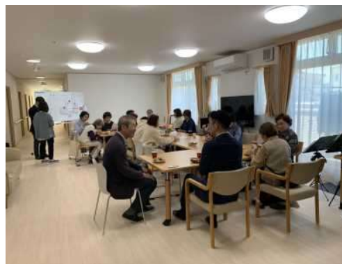
画像⑩ 自主製品・活動告知

※お持ちの資料は編集可能です。地域サロンや障がい者福祉学習会等で自由にご使用ください。