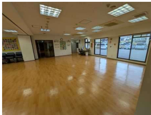
画像12 地域健康・体力測定会

握力測定や歩行計測など、健康指標を可視化。ただ集まるだけでなく、確かな予防効果を追及します。