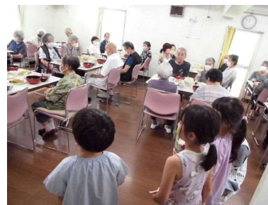
画像① 誕生祝プレゼント

※写真は当時の実際の様子を撮影したものです。世代を超えた絆が笑顔に現れています。