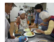
画像⑪ 越路調理施設