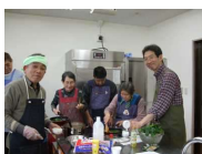
画像⑩ 施設キッチン

※お持ちの資料は編集可能です。地域サークルでのご検討時など、ご自由にお使いください。