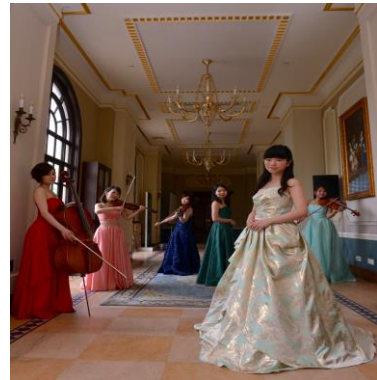
ユースクラシック