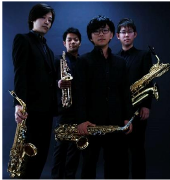
サクソカルテット Adam